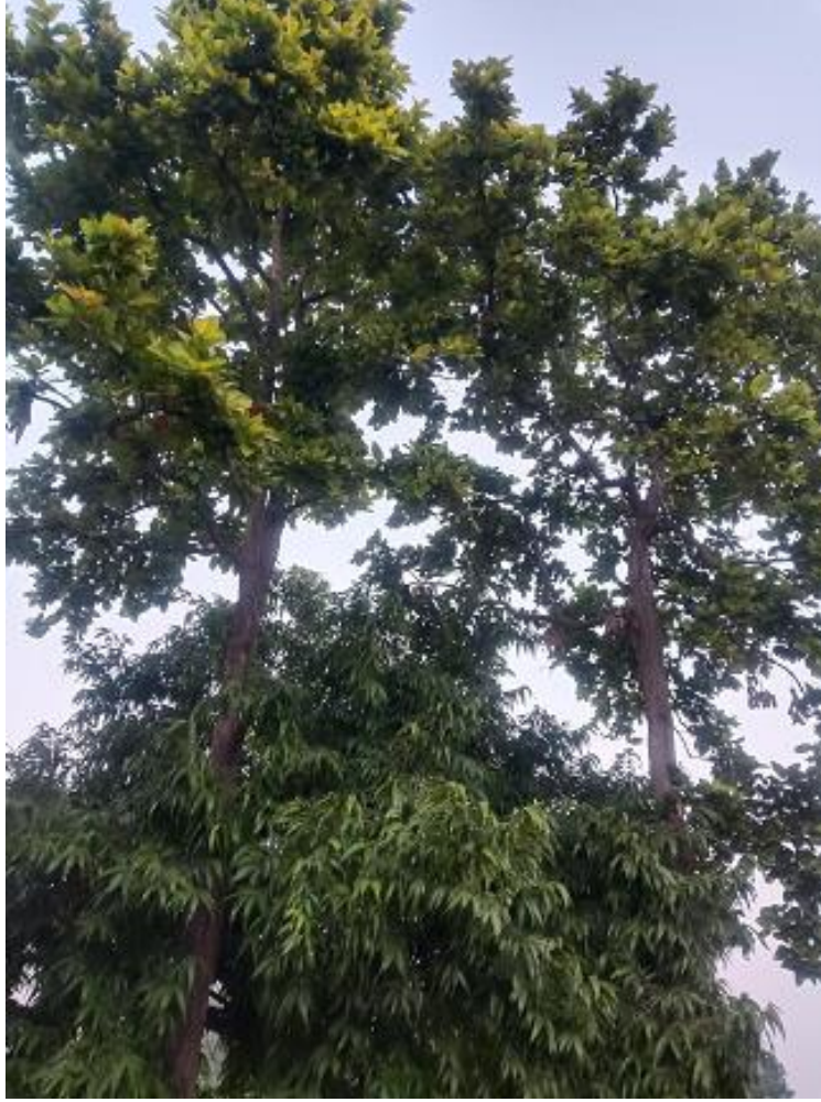
परिसरात असलेले दोन नवीन साल वृक्ष

ठरलेल्या प्लॅनप्रमाणे ट्रेनमधून ७ वाजता नौतन्चा रेल्वे स्टेशनला जाऊन तिथून लगेच बसने नेपाळला जाणार होतो. पण ट्रेन लेट होऊन १० वाजता आम्ही बसमधून निघालो. इंडो नेपाळ बॉर्डरवर एकदा भारताच्या बाजूला आणि एकदा नेपाळच्या बाजूला इमिग्रेशनच्या फॉर्मलिटीज पूर्ण करून आम्ही दुपारी २ वाजता हॉटेलमध्ये पोचलो. जेवून, विश्रांती घेऊन साडेतीन वाजता लुम्बीनीला जायला निघालो.