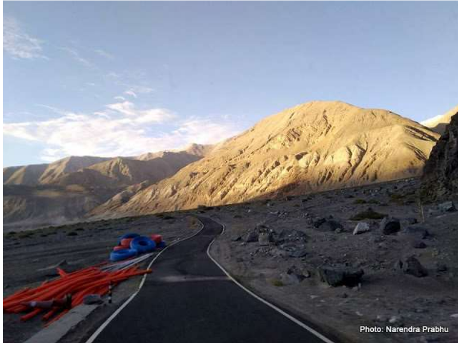
ब्रॉड बॅन्डची लाईन टाकण्याचं काम