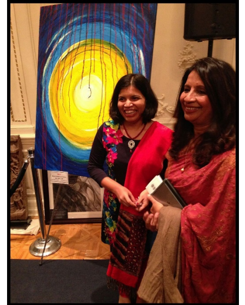
भारताच्या पूर्व-राजदूत सौ. निरूपमा राओ यांची प्रदर्शनास भेट