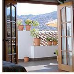
खोलीबाहेरच्या पॅसेजमधून दिसणारा कुस्कोचा देखावा