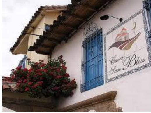
'बुटिक कासा सान ब्लास'

पेरूत आम्हाला बघायचं असलेलं मुख्य आकर्षण होतं माचु पिचू. पण तिथे आंतरराष्ट्रीय विमानतळ तर सोडाच, पण देशांतर्गत विमानतळदेखील नव्हतं. पेरूची राजधानी लिमा. तिथे अर्थातच आंतरराष्ट्रीय विमानतळ आहे, पण इंटरनेटवर तरी लिमात करण्याजोगं विशेष काही दिसेना. आणि लिमाहून माचु पिचूला जाणं देखील कठीण वाटलं. वेगवेगळ्या पर्यटन आयोजकांच्या वेबसाईट्सवर आणखी एक महत्वाचं ठिकाण दिसत होतं, ते म्हणजे कुस्को. ('कुस्को पेरू'वरही काही मालवणी विनोद झाले.) कुस्कोतील वेगवेगळ्या सहलींची माहिती तर आम्हाला आवडलीच, शिवाय तिथून माचु पिचूला जायचेदेखील बरेच पर्याय दिसले. म्हणून आम्ही कुस्कोतच मुक्काम करायचं ठरवलं.