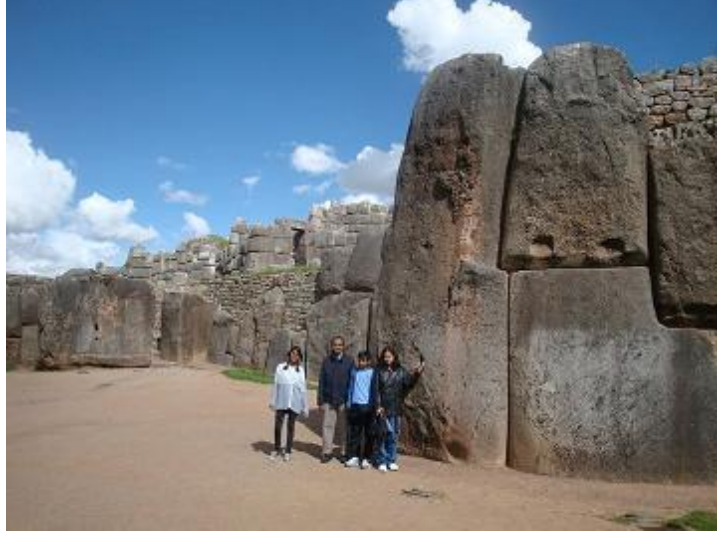
सॅक्सायवामान भागात इंकांनी बांधलेली प्रचंड भिंत

कुस्कोचा सॅक्सायवामान भाग म्हणजे इंकांचा किल्लाच होता. सोळाव्या शतकात (यादवी आणि स्पॅनिश आक्रमणाच्या दरम्यान) इथे बऱ्यापैकी लढाई झाली होती. स्पॅनिश आक्रमणाच्या पूर्वी इथे बुरुज होते, बरीच कोठार होती आणि इतरही छोट्या-मोठ्या इमारती/वास्तू होत्या. एक सूर्यमंदिर आणि मोठ्ठं मोकळं आवारही होतं. म्हणजे तिथे धार्मिक विधी होत असावेत. इथेच एका chamber मध्ये विसाव्या शतकात mummies ही सापडल्या होत्या. स्पॅनिश लोकांनी हे सर्व तोडून, त्यांतले दगड वापरून आपल्या वसाहतींमध्ये घरं बांधली. आता फक्त अवशेष उरले आहेत आणि भल्या मोठ्या (तटबंदीच्या) तीन भिंती अजून आहेत. ह्या भिंतींची उंची ६ मीटर्स आहे आणि सगळ्यात लांब भिंतीची लांबी ४०० मीटर्स आहे. ह्या भिंतींचं वैशिष्ट्य म्हणजे त्यांत वापरलेले बहुतेक दगड हे प्रत्येकी १२० ते २०० टन वजनाचे आहेत. हे एकमेकांवर आणि एकमेकांशेजारी कुठल्याही सिमेंट/चुना/mortar सारख्या पदार्थाविनाच इतक्या अचूकतेने जोडलेले आहेत की त्यांच्यामधून एखादा पातळ कागद देखील जाऊ शकणार नाही. ह्या अशा रचनेमुळेच म्हणे १९५० साली कुस्कोत झालेल्या भूकंपात देखील ह्या भिंतींना काहीही इजा पोहोचली नाही. स्पॅनिश लोकांनाही ह्या भिंती तोडता आल्या नसाव्यात किंवा एवढे मोठे दगड तिथून हलवता आले नसावेत, म्हणूनच त्या टिकल्या असाव्यात असं म्हणतात. मुळात इंका लोकांनी देखील ते कसे ओढत आणले असतील कल्पना करवत नाही. ते तर म्हणे चाकही वापरत नव्हते.