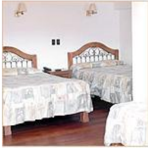
३ पलंग असलेली खोली

अशाच एका बोळात एका ठिकाणी आम्ही उतरलो. इथून एका छोट्या फाट्यावर वळून आमच्या हॉटेलच्या आवारात शिरलो. तिथेही परत आमचं अतिशय अगत्यशीलपणे स्वागत झालं. त्यांनी आम्हा सर्वांना त्यांचा पेरुव्हियन पद्धतीचा कोका नावाच्या वनस्पतीच्या पानांचा चहा दिला. तो मात्र काढ्यासारखा लागत असल्याने आम्हाला पिववेना. आधी रस्त्यांवर पाहिलेल्या हॉटेलसप्रमाणेच आमचं हे हॉटेल 'बुटिक कासा सान ब्लास' आणि त्यातली आमची suite देखील लहानच वाटली. अर्थात तरीदेखील हॉटेल आणि खोली चांगली, नीटनेटकी आणि स्वच्छ होती. स्टाफ अगत्यशील आणि कार्यतत्पर होता. खोलीदेखील तशी आमच्यासाठी पुरेशी मोठी होती. तीन मोठे पलंग होते. टेबल-खुर्च्या होत्या. बाहेर उघडा पॅसेज होता, त्यामुळे खोलीबाहेर आल्यावर कुस्कोचा सुंदर देखावा दिसे.